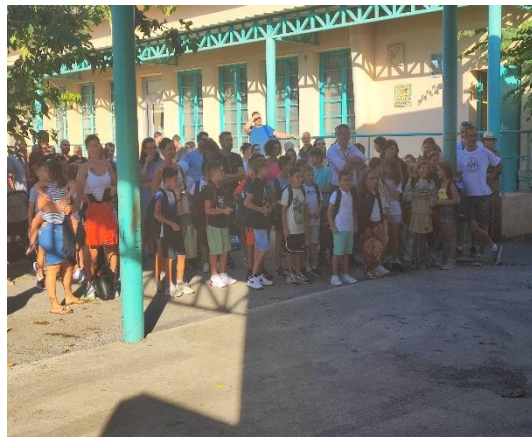
Les retrouvailles avec les copains