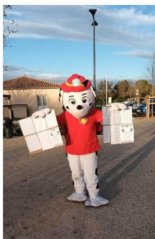
Marcus, la Mascotte 2022-2023 !

Du 10 au 14 octobre, tous les enfants de l'école maternelle ont fêté la semaine du goût. Grâce à la participation des parents qui ont fourni les aliments ou participé à des ateliers dans les classes, les enfants ont goûté fruits, légumes et céréales. Au menu, ils ont cuisiné de la soupe, de la salade de fruits et des roses des sables avant de s'en délecter ! Ils sont tous repartis avec leur toque de cuisinier.