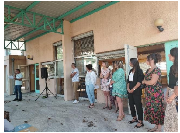
Top départ pour une nouvelle année