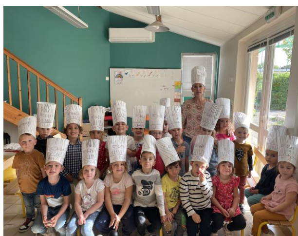
Les petits chefs de la classe de Madame LEBRE