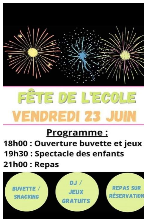
Fête de l'école élémentaire