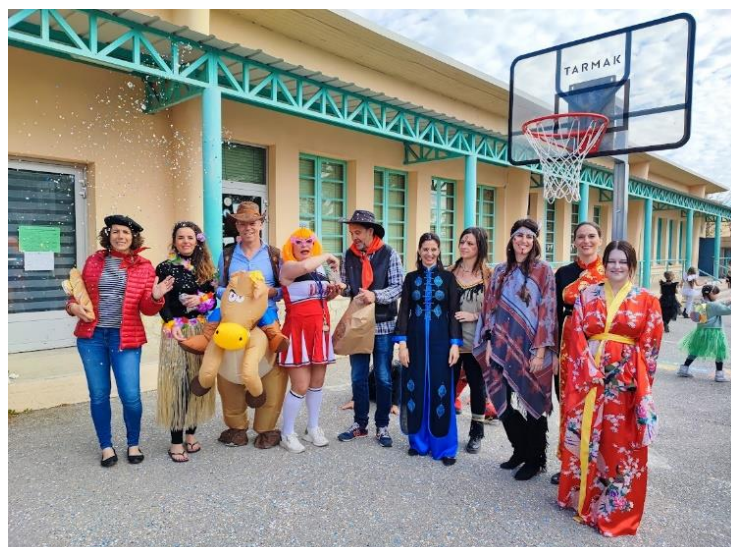
Equipe éducative de l'école élémentaire