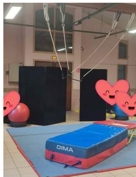
Le foyer transformé en chapiteau de cirque