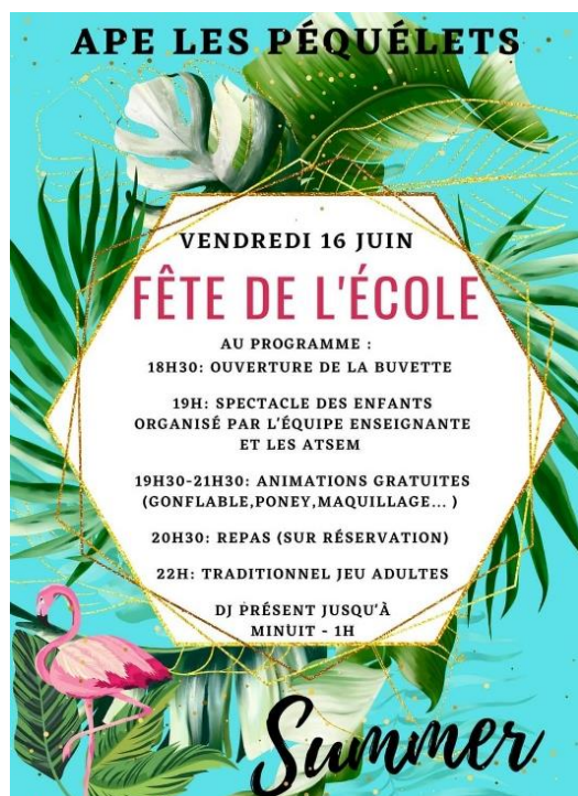
Fête de l'école maternelle