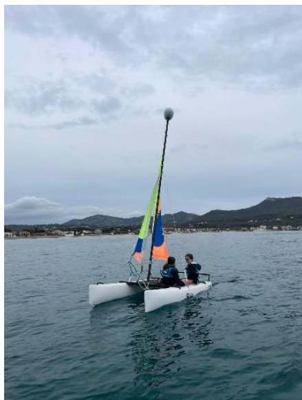
Les cm1/cm2 à St Cyr/mer