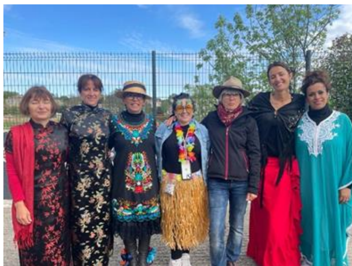
Enseignantes et ATSEM de l'école maternelle