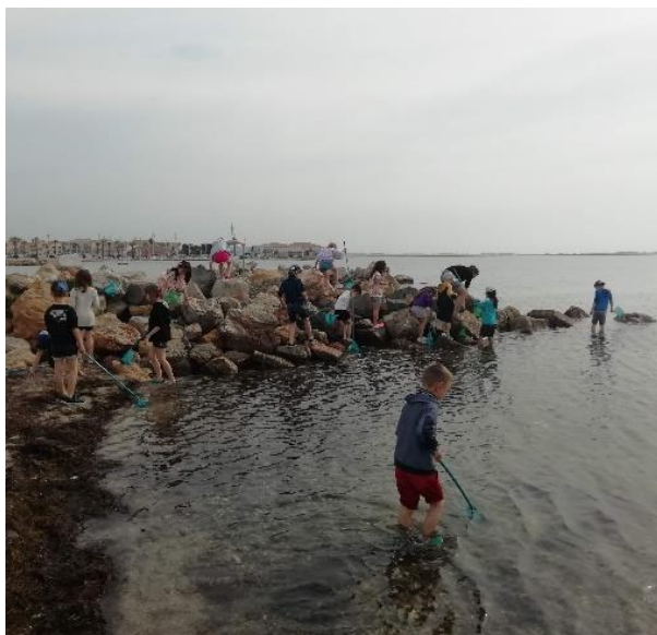
Pêche à l'épuisette pour les CP/CE à Mèze